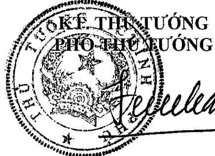
Lê Minh Khái