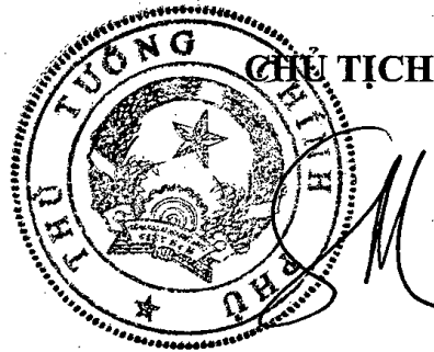
PHÓ THỦ TƯỚNG Phạm Bình Minh

3. Bộ Tài chính có trách nhiệm hướng dẫn chế độ chi tiêu và bố trí kinh phí phục vụ công tác chuẩn bị và tổ chức các hội nghị, hoạt động của nhiệm kỳ Chủ tịch ASEAN tại Việt Nam năm 2020; là cơ quan thẩm định, trình Thủ tướng Chính phủ phê duyệt và giao kinh phí thực hiện cho các cơ quan, địa phương liên quan./.